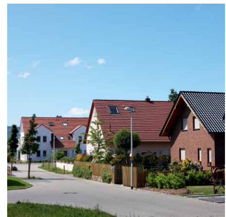
Beim Nahwärme-Contracting teilen sich mehrere Haushalte eine Wärme-erzeugungsanlage.

Eine spezielle Form des Contractings ist das sogenannte Nahwärme-Contracting. Die Konzepte von Nah- und Fernwärme lassen sich zwar nicht trennscharf voneinander unterscheiden, wichtig ist dabei jedoch die Länge der Übertragungsleitung für die Wärmelieferung. So bedeutet Nahwärme eine Übertragung von Heizwärme zwischen benachbarten oder nahe beieinanderstehenden Gebäuden. In der Praxis teilen sich beim Nahwärme-Contracting mehrere Haushalte eine gemeinsame Wärme-erzeugungsanlage, die durch uns betrieben, betreut und gewartet wird. Also ein Contracting mit mehreren Wärmeabnehmern, die nicht alle im selben Gebäude leben. Da anders als bei der Fernwärme die Einheiten der versorgten Haushalte kleiner sind, lassen sich dafür sehr gut auch innovative kleine Kraft-Wärme-Kopplungs-Anlagen sowie erneuerbare Energien einsetzen. So eignen sich beispielsweise Mini-Blockheizkraftwerke oder solarthermische Anlagen je nach Wärmebedarf hervorragend für ein Nahwärme-Contracting-Modell. Bei allen Contracting-Lösungen zahlen wir als Betreiber sämtliche Investitionen, Reparaturen sowie Wartungsarbeiten und übernehmen die sachkundige Planung, Installation und die Betreuung der neuen Anlage.